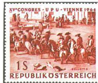
Postillón en palacio, de un cuadro de Bernardo Bellotto (siglo XVIII), reproducido en un sello de Austria, con ocasión de celebrarse un Congreso de la Unión Postal Universal.