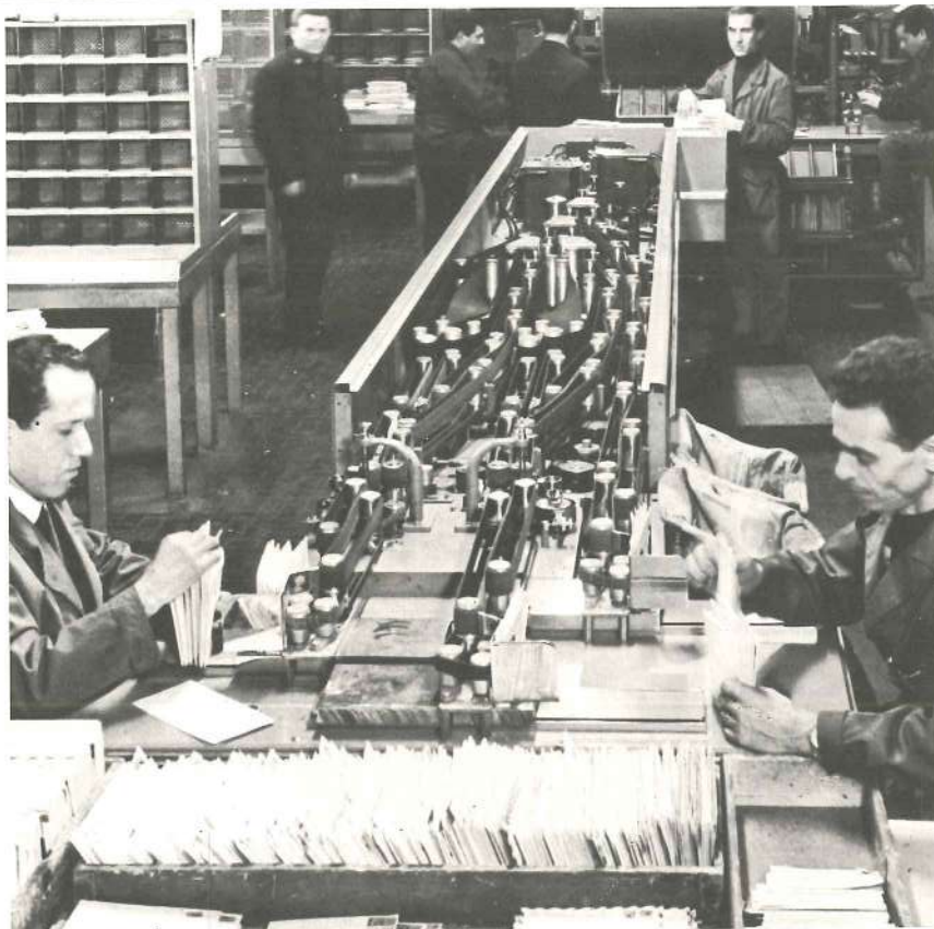
Arriba, a la izquierda: una bonita serie suiza que muestra antiguos mensajeros de distintas épocas; a pie, a lomo de mula y a caballo.

En el campo europeo, las relaciones postales reverdecieron gracias a la acción de la familia Tassis: Omodeo, antepasado del poeta Torcuato, comenzó a finales del siglo XIII; y en el XVI, sus descendientes obtenían de Carlos V el «generalato» postal heredado del Imperio. Los correos de los Tassis recorrían con regularidad Italia, Francia, Alemania, Flandes y